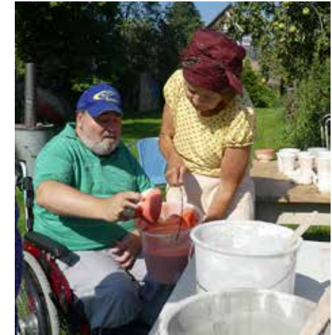
RAKU - Hautnah miterleben

Und am Ende der Woche war es dann soweit: Wir haben an der Vernissage fröhlich gefeiert, einen Apero serviert und viele Gäste bestaunten unsere Werke!