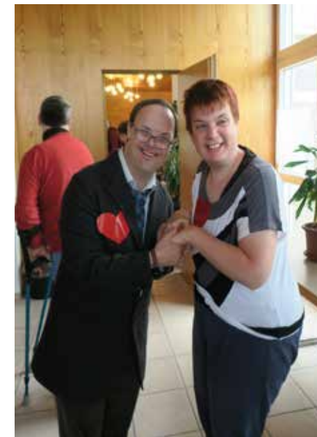
Am Maien-Tanz mit Flirt-Party im Café Treff Di